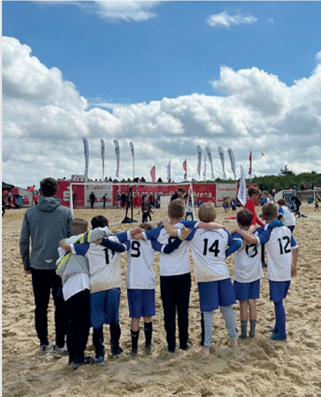
Im Juni findet wieder die Jugendfahrt der JSG zum Beach-Soccer Turnier in Cuxhaven statt. 150 Teilnehmer/innen (Kinder / Eltern) fahren mit.